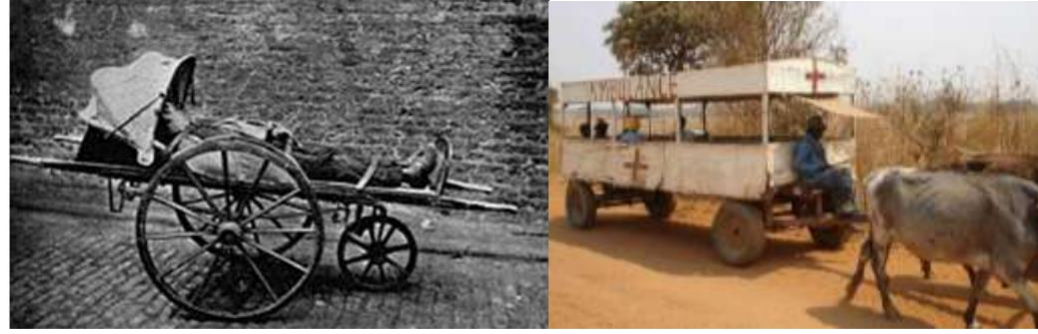
İlk ambulans benzeri araçlar